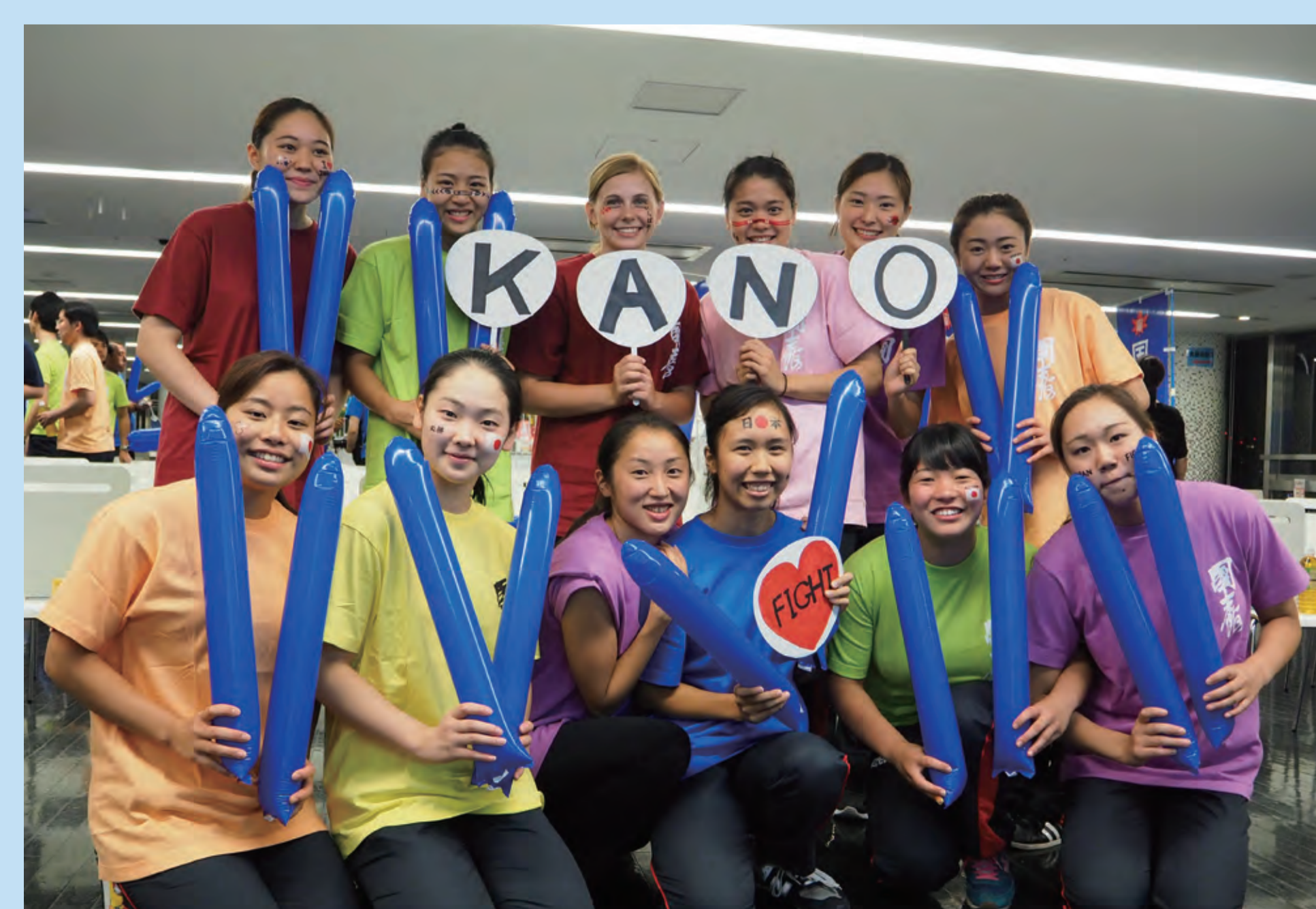
リオオリンピックパブリックビューイング