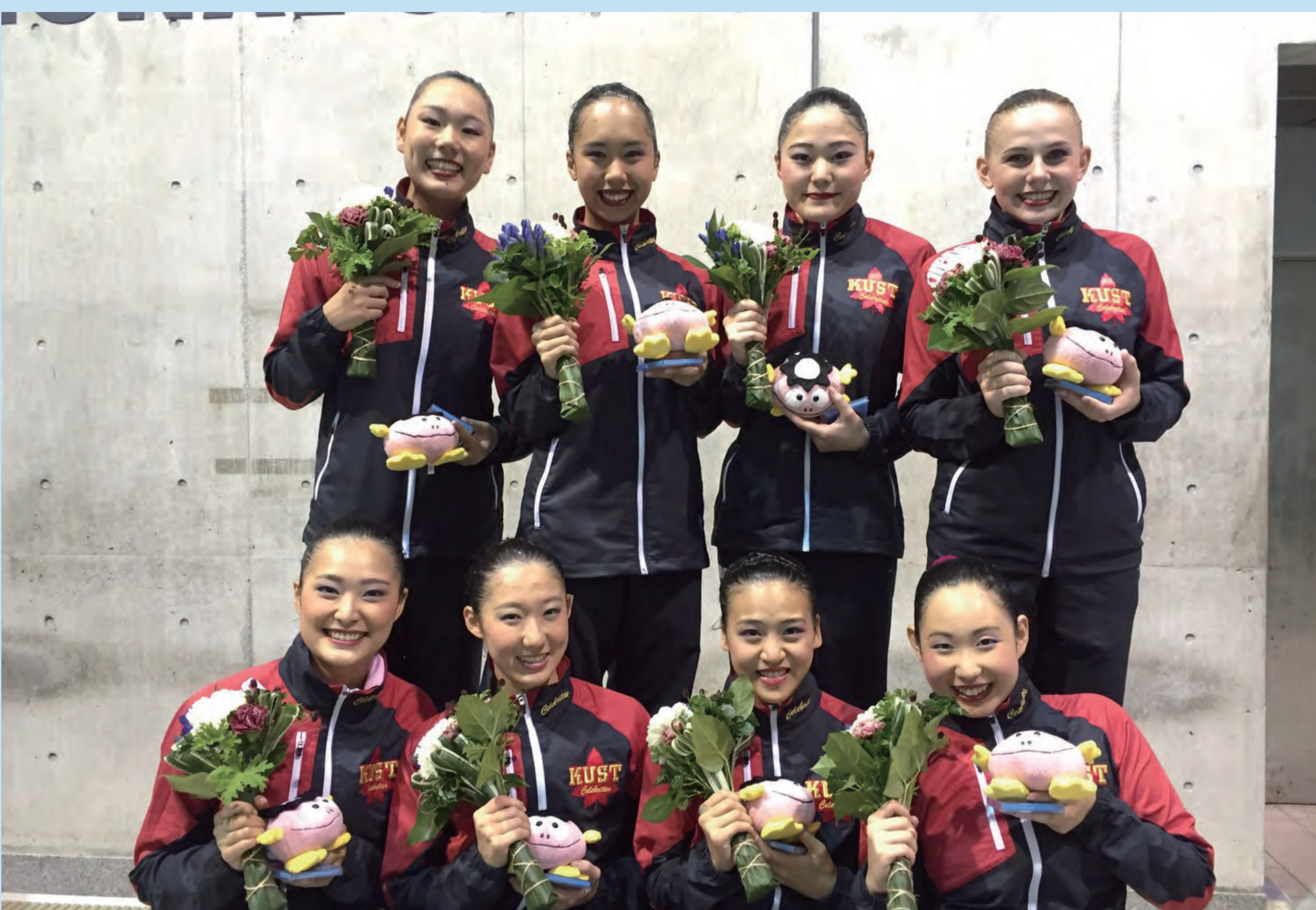
2016 インカレチーム優勝表彰時