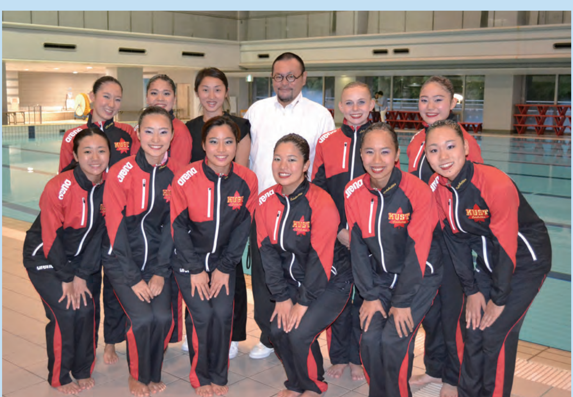
2016年インカレでの集合写真