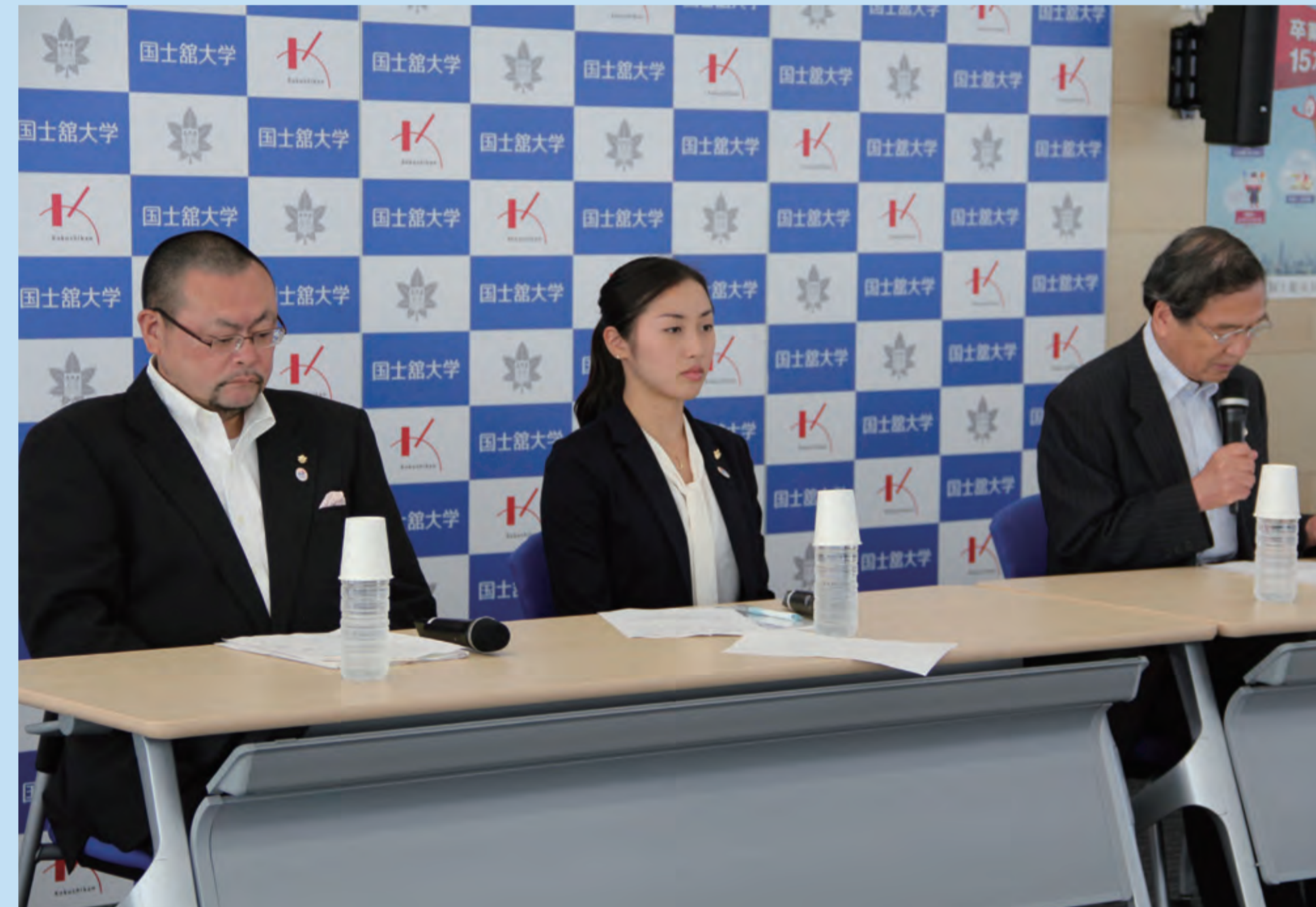
創部・監督就任会見