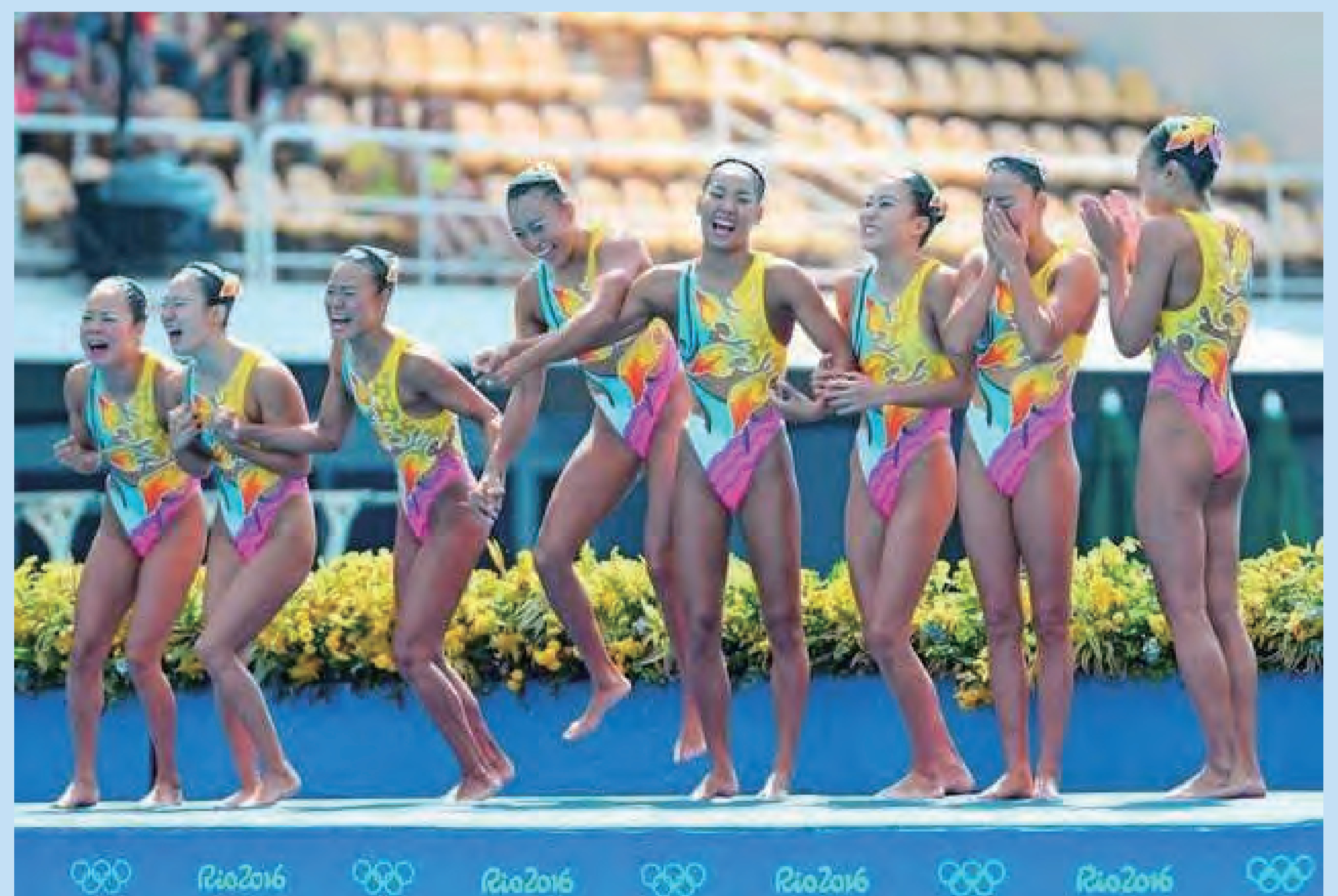
リオオリンピック銅メダル獲得決定の瞬間