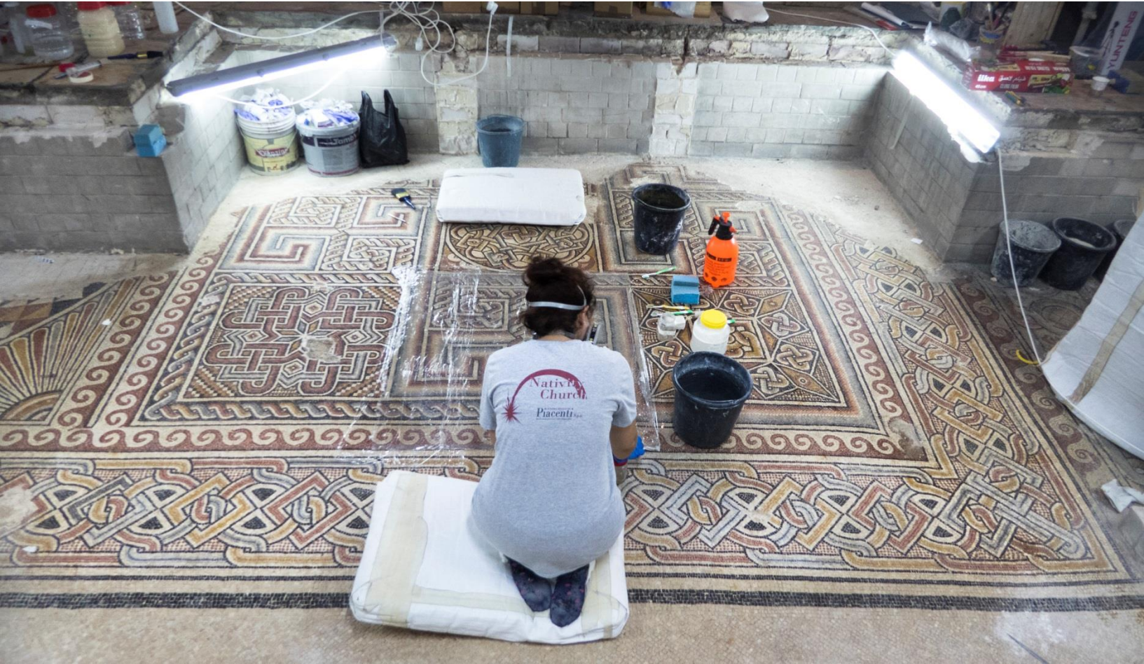
聖誕教会の床モザイクの修復

聖地エルサレムから南南西に8キロの位置にあるベツレヘム聖誕教会は、2012年にパレスチナ自治区内で初めてユネスコ世界遺産に登録されました。登録に際し、教会の躯体が崩落する可能性が指摘され、危機遺産としても同時に登録されました。イタリアのフェッラーラ大学によって調査研究が行われ、保存修復事業については同大学の助言の下で、イタリアのプラトに本部を持つピアチェンティ社が行うこととなりました。